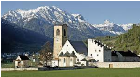
Kloster St. Johann