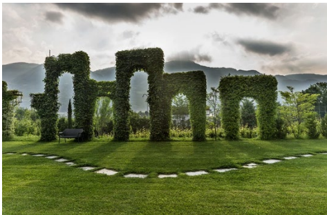
7 Gärten des Kränzelhofs